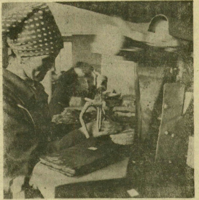
Félautomata csomagolja a féledés szegedi paprikát

Ha hihetünk a történeli forrásoknak, a paprikát Európába Columbus útítarsa, Chanca orvos hozta be 1494-ben. Először az Ibériai félszigeten kezdtek el természeteni. Kezdetben dísznövényként kezelték. Magyarországon a paprika az 1500-as években honosodott meg. Régi neve, a törökbors utal arra, hogy a félhold országának lakói honosították meg nálunk. A 18. századból több feljegyzés tanúsítja, hogy je-