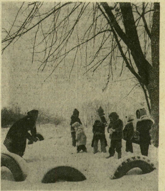
Találékonyak az emberek. Búzaszákot tettek a kocsi hátuljába, úgy vitték el a tanyai gyerekeket a kancsalszéli óvodába. Igaz, tegnap nem harmincketten, csak heten hógolyóztak a játszótéren

Az úthálózat felelőseit nem érte váratlanul a havazás. A KPM útügyelete — az előző napi meteorológiai előrejelzés birtokában — idejében felkészült a beavatkozásra. A hajnali órákban 25 sószerű géppel, 120 ember közreműködésével kezdtek az utak szórásához. Reggelre a megye teljes főútvonal-hálózatát leszórták, s ezután láttak az alsóbbrendű utak szórásához. Később gumiútló hókékkal kezdtek eltakarítani