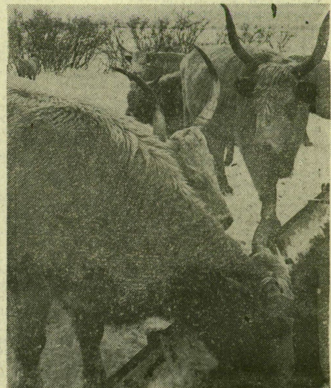
A Kiskunsági Nemzeti Park felügyelete alatt álló Bugacpusztán, a harminc-negyven centiméteres hóban és a mínusz tíz-tizenöt Celsius-fokos fagyban is a szabadban telelnek az ősi magyar szürke marhák és a racka juhok. Képünkön: magyar szürke marhák az itató körül

Hatszázézerrel nőtt öt év alatt az anyajuhállomány. A juhhúsból feivel adtak többet az üzemek és a kistermelők 1980-ban, mint 1975-ben és 40 százalékkal több gyapjút adtak át a feldolgozó üzemeknek. A baromjitenyésztők, — tartók is fedezték a szükségletet. A nemzetközi élvonalban van továbbra is az egy főre jutó hazai tojásfogyasztás, amely öt év alatt 280-ról 320–330 darabra nőtt.