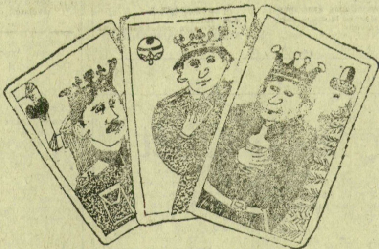
JURIDA KÁROLY RAJZA