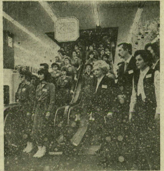
A nagyáruház eladói