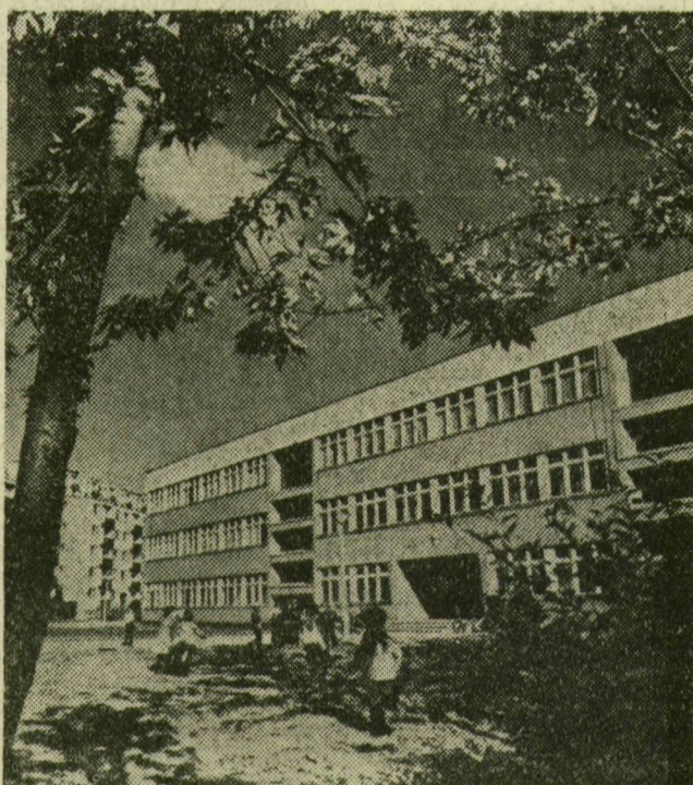
A IV. számú iskola úde színpolt Tarjánban