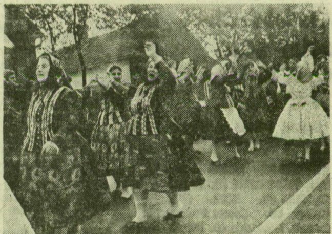
Tápai asszonyok felvonulása

Kérdés: ki mit lovagol nálati tárgyak mintha győz-nének a hivalkodó, csicsás lim-lomon. Vagy: csak hisz-szük, mert akarjuk? * A gyerekek mindenesetre mindenáron dorombot akartak. Meg Vitéz Lászlót, újra és újra. Kemény Henrik egy-személyes bábszínháza stíl-szerű és fergeteges sikerű produkció volt a vásár közepén. Miként kétféle volt a vásár, kétféle a mutatvány. És megint úgy tűnt, Vitéz László dacolni képes a for-gók, óriáskerékek, céllövöl-dék vonzásával. * „Ünnepünk. Megfér sok ember, sokféle dolog együtt” — mondta az idős bácsi, helybéli, aki szótól árult a törökmezés pult meg az óriáskerék között, a forgalmas átjáróban. A céllövöl-dében, dolognélküliségben az erősítő elé költözött a puska-töltőgató fiatalember és jó-kedvűen táncolt a diszközepén. Egy fiatalasszony a fe-kete cserepeket kereste, út-baigazították, a Fazekasék kiállítása a tanácsházán. A ronda szörkutyát megvették a szipogó kisfiúnak, ne fá-jjon a szíve érte. S. E.