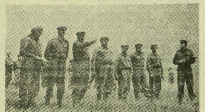
A célpont távolsági bemérése