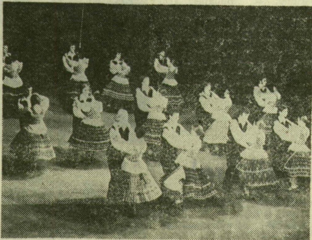
Részlet az ÉDOSZ fesztiválprogramjából

A napokban hazaérkezett ÉDOSZ-táncosok és zenészek méltó hírvivői voltak néptáncművészetünknek: már hírt adtunk róla, hogy harmadik díjat, hatalmas láncon függő bronz érmét szereztek. A fesztivál szervező bizottságának sajátos értékelése alapján a feldolgozott (az ő kifejezésükkel: stílizált) táncgyűtteseket előadó együttesek közé sorolták a szegedieket, így kerültek olyan versenytársakkal azonos kategóriába, mint például a Fülöp-szigetek hívatásos, állami népi együttese. A szigorú zsűri (magyar tagja: Novák Ferenc koreográfus) mindazonáltal minimális pontkülönbséggel helyezte az ÉDOSZ elé az egzotikus táncművészeket magas művészi szinten előadó profi együttest. A verseny előmezője így alakult: aranyérmét kaptak a csodálatos, ősi táncokat és elkápráztató kosztümöket fölvonultató törökországi versenyzők, második díjat a fülöp-szigeti táncosok (a helyi lap fotói alapján nyilvánvaló, hogy az együttes hölgytagjainak bübös szépsége is hatással le-