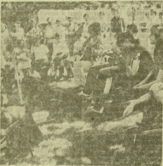
Politikai dalok előadói és közönségük

nek. Mintha vezetőik vagy az ismeretlenek előtt nem szívesen mondanák el véleményüket. Pedig baráti társaságban, szűk munkahelyi közösségben vagy a kollektív szobában nagyon ösztönözten beszélnek lezser, mélyesebb dolgairól — épp úgy, mint mozgalmi tapasztalataikról vagy a politikai eseményekről.