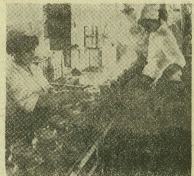
Öt kilogrammos üvegekbe töltik a savanyúságot