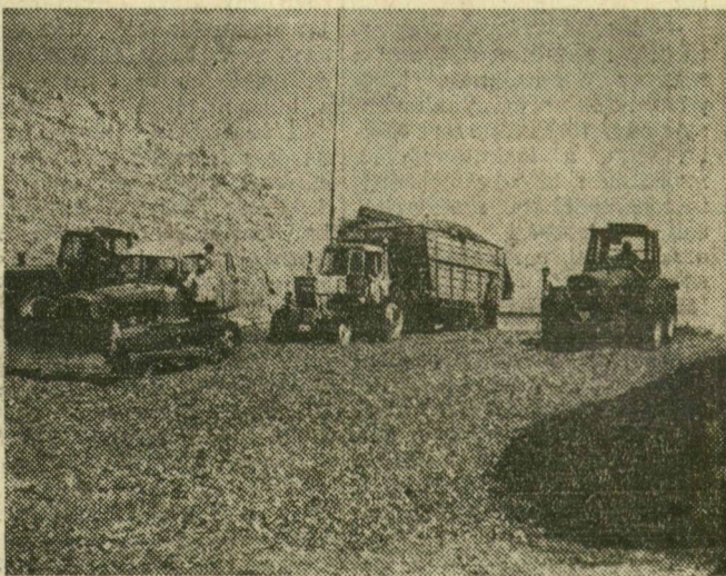
Képünkön: silóznak Zákányszéken

A város többi gazdaságában is az ősze készülnek, szántanak, javítják a gépeket. A homoki szövetkezetben is hasonló munkák adnak elfoglaltságot. Zákányszéken silóznak. Kisterkeken készülnek a burgonya betakarítására, Ópusztaszeren török szárítják a dohányt, Sándorfalván a talajt készítik elő. Mórahalmon szedik a paradicsomot, Zsombón és a szatymazi homokvidéken pedig a konzervnek való barackot.