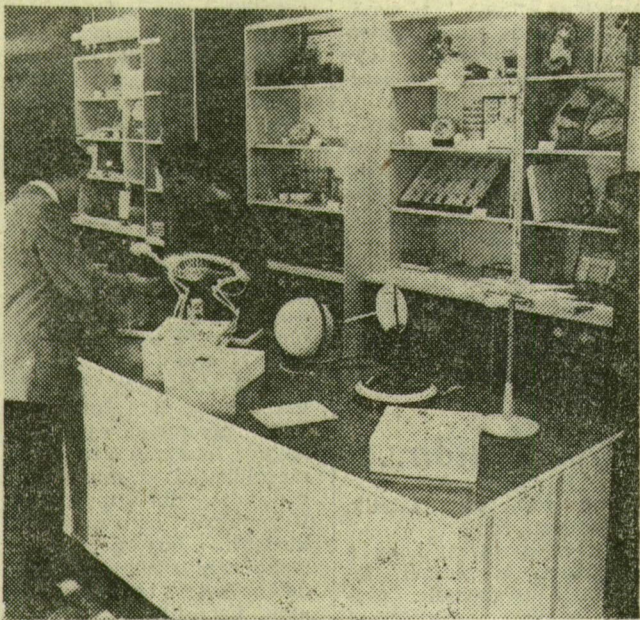
Az új épület gazdag választékkal várja vásárlóit

Az üzlethálózat bővítésének keretében, a megyei és a városi tanács segítségével, több mint 1 millió forintot költséggel Szegeденen is megnyitotta taneszközboltját a TANÉRT Vállalat. A Csongrádi sugárút 104. szám alatt található 9-es számú üzlet Bács, Békés és Csongrád megye oktatási intézményei-