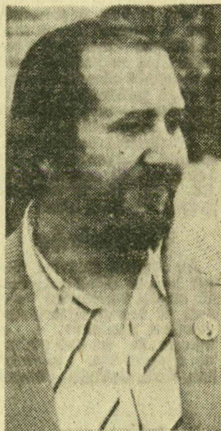
Próba előtt, még civilben

— Igen, tudom. S azt is, hogy a közelmúltban szegedi művészfeladatok járt Odesszában, sajnos, akkor éppen nem voltam otthon, nem láthattam-hallhattam őket, nem találkozhattam velük. Most ezt is pótolom. Egyébként mindig van, ami engem személy szerint emlékeztet a két város egy-egy fejlődő kapcsolatára, a még kiaknázatlan lehetőségekre, egyáltalán: a barátság tényére. Ugyanis nap mint nap elmegyek a „testvérvég” mellett, amely Szeged és Odessa közösségét hirdeti; nem messze lakom tőle, s ami még az én városomat illeti: szeretnék meleg hangulatot — s hasonló időt hozni onnan a Dóm térére.