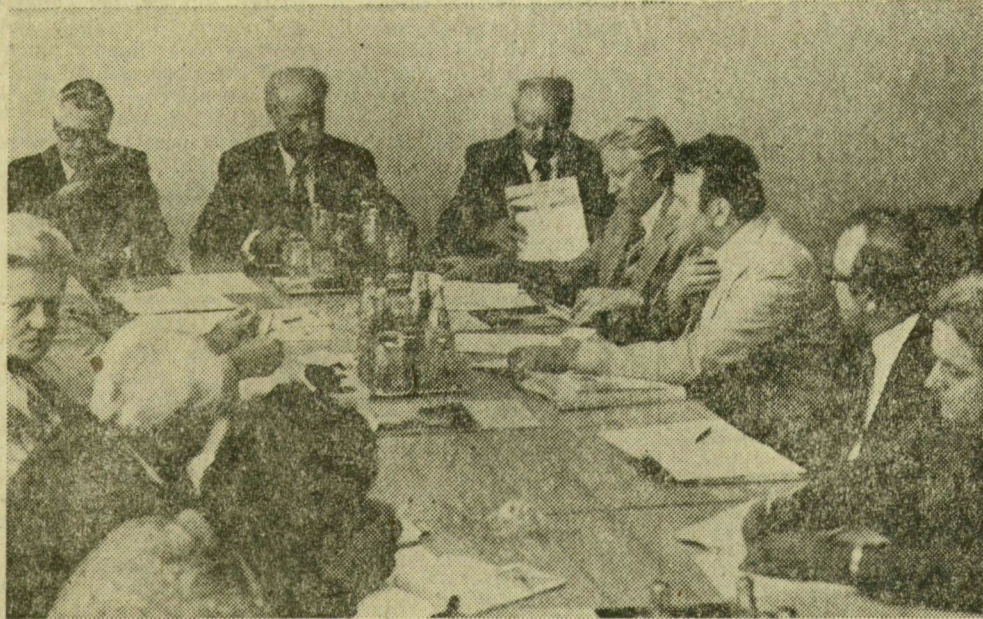
Munkában az Ópusztaszeri Országos Emlékbizottság