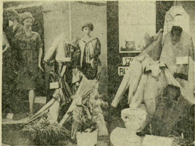
A szegedi városi tanács vb nagydíjjal kitüntetett új termékek kollektívja a Szegedi Ruhagyár standján

őszi budapesti OMEK-on kerül sor. Ma, vasárnap délután adják át a közönség szavazatai alapján a nagydíjat és a díjakat. A vásár rendezői azt remélik, hogy a zárás napján még legalább huszonötezer ember látogat a kiállításra és erre fölkészültek minden tekintetben.