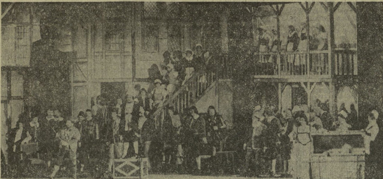
A SZABADTÉRI VASÁRNAPI FALSTAFF-BEMUTATÓJÁNAK LÁTVÁNYOS SZÍNPADKÉPE

Martonvásáron 250 húshasznú, magyar tarka, illetve keresztezett fajtájú tehenet tartanak a kukoricaszár hasznosítására, a Ka-hyb sertéshús-termelési rendszer bemutatja a már világhírű tenyészállataikat. Az év eddig eltelt részében több száz millió forint értékben készültek mezőgazdasági gépek, felszerelések a győri Rába Magyar Vagyon- és Gépgyárban. Az augusztusi országos mezőgazdasági kiállításban a Rába felvonultatja a sorozatban gyártott és a fejlesztés alatt levő típusait is. Az ország legnagyobb vetőmagtermelő gazdasága, a bolyi kombinát, bővítette termékeinek választékát, és most ötféle vetőmagot mutat be: búzát, kukoricát, borsót, szóját és babot. A Bikali Állami Gazdaság két országos állattenyésztési rendszer gesztora: a nyúlé és a halé. Mindkét terméket felvonultatja a kiállításon, elsősorban tenyészállatok és technológiai eszközök. A szigetvári agrokémiai társulás, az eddig szerzett hasznos tapasztalatait teszi közzé a kiállításon. Az „Egri KR-3” típusú kéregzőgép a fahasznosítás szempontjából különösen előnyös. Az egri kéregzőgép kiválóan alkalmas durvább felületű rönkök kéregzésére is, s a KGST-országok elfogadott erdőszeti alapgépe. (MTI)