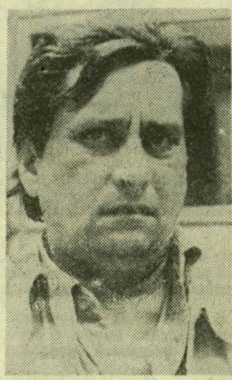
A szerző, premier előtt

Háromfelvonásos történelmi drámáját a szabadtéri előadás sajátosságaira való tekintettel meg kellett rövidíteni. Ami önmagában szerkeszti és hangsúlyváltozókkal járhat együtt.