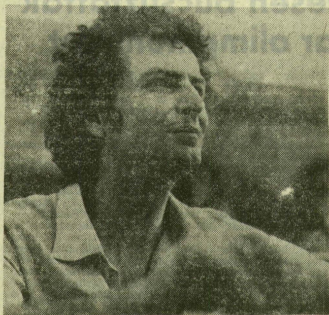
Trikolidisz vezényli a Falstaffot

— A karmesternek milyen feladatokat jelent a Falstaff és a szabadtéri színpad?