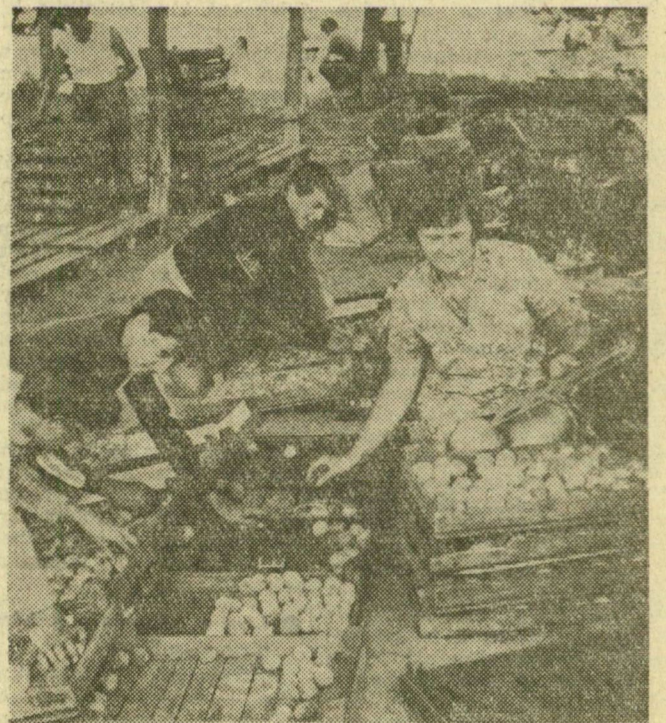
Piacra készítik az őszi barackot a mórahalmi Homokkútúra Szakszövetkezetben

utána megsodorják, majd hurkológépekkel könnyű hálóvá alakítják, amely a napsugarak egy részét felfogja, a levegőt átengedi, ugyanakkor az esetleges jégveréstől is megóvjaa a primőröket, virágokat. Az év végéig mintegy 200 000 négyzetméter ilyen finom hálót gyártanak javarészt mezőgazdasági nagyüzemeknek.