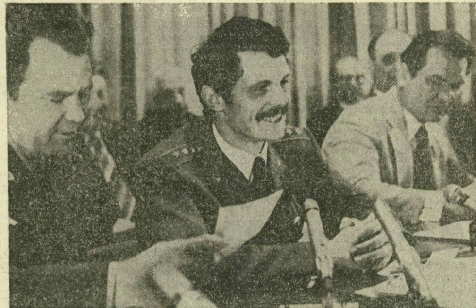
Sajtókonferencián számolt be Moszkvában a világhírűen végzett kutatásokról tegnap, csütörtökön Valerij Kubaszov és Farkas Bertalan. A szovjet—magyar úrpáros sajtókonferenciáján részt vett a szovjet úrkutatás számos vezetője. Közülük: Satalov altábornagy, Farkas Bertalan és V. Kubaszov. A sajtókonferenciáról tudósítás a 2. oldalon

sen fejlesztették ugyan a „víztermelő”-kapacitást, de a szűk keresztmetszetű csőhálózat miatt az ivóvíz szétosztásának lehetősége továbbra is korlátozott.