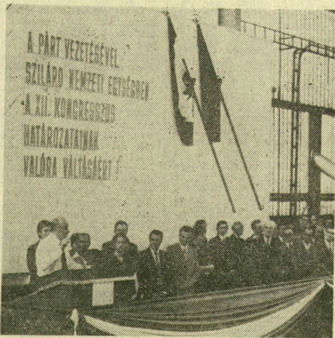
Választási nagygyűlés a Magyar Hajó- és Darugár hajóműhelyében. Képünkön: az elnökség

A nemzetközi reakció és az imperializmus azért élgedetlen az enyhülés éveivel, mert közben Kubában meg erősödött a szocializmus. Angola szabad lett, Mozambik megszabadult a gyarmati sorsától, Etiópia önálló fejlődésének útjára lépett, Dél-Jemenben szocialista célokat tűztek ki. Nem azért, mert valamilyen szovjet vagy NDK-beli ügynök márkát vagy rubelt adott valakinek, hogy „lázdadjon föl”, hanem