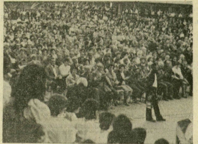
A zsúfolásig megtelt szegedi Sportsarnok

— Pártunk Központi Bizottsága, a kormány és a Hazafias Népfőnt Országos Tanácsa nevében azt kérem Csongrád megye, Szeged választópolgáraitól, hogy támogassák politikánkat, mert ennek megvalósítása révén gyarapíthatjuk szocialista hazánkat. Egyúttal megköszönöm képviselőtársaimnak és a tanácsstagoknak azt a hasznos közéleti munkát, amelyet megbízatásuk egész ideje alatt végeztek a választókerületekben és a választókerületekben. Csongrád megye lakosságától, valamennyi választópolgártól pedig azt kérem: a június 8-i választáson támogassák pártunk és kormányunk politikáját, szavazzanak a Hazafias Népfőnt jelöltjeire.