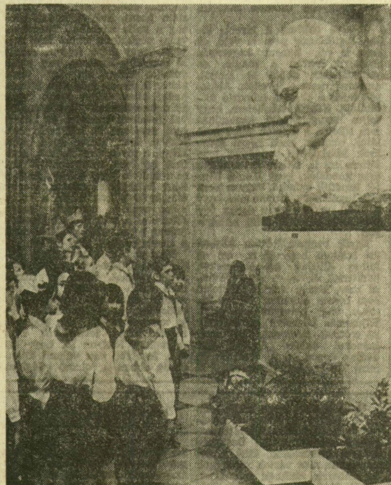
A Központi Lenin Múzeum előcsarnokában

nyelvén. Hallható a hangja: itt a nyomdagép, amelyen az Iszakra első példányát nyomták.