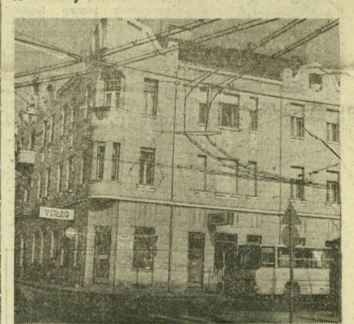
A házakat mondják „győztesnek”, pedig igazából azokat tekintjük nyertesnek, akik a felújításban közreműködtek. A szegedi városi tanács végrehajtó bizottsága tavaly is meghirdette a lakóház-felújítási pályázatot, amelynek eredményét képeinkkel mutatjuk be olvasóinknak. A felújítást versenyt a Szegedi Magas- és Mélyépítőipari Vállalat nyerte meg, az Attila utca 11. számú házzal, második pedig az IKV lett, a Jósika utca 19. és 21-es számú házzal.