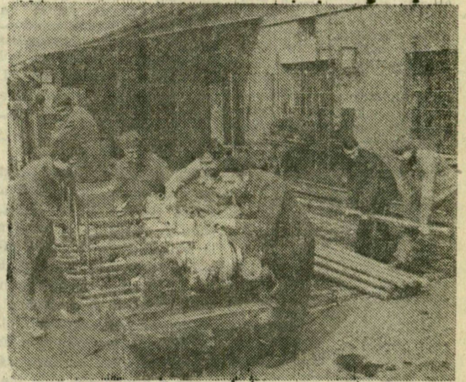
Szerelők dolgoznak a MÁV gépjavítóban