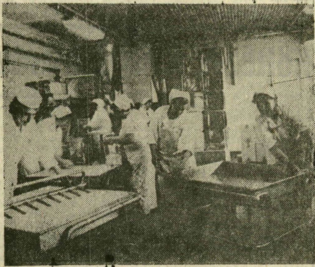
Exportra készítenek sajtót Kisteleken