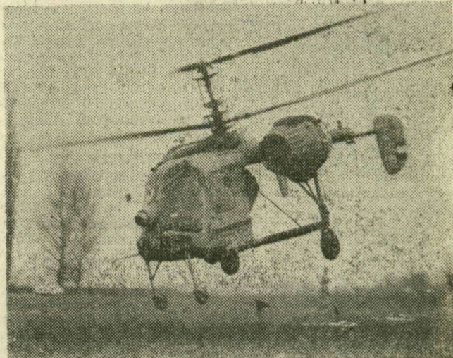
Tele a tartály, útnak indul a helikopter

A helikopteres megoldás olcsóbb is, mintha merev szárnyú gépekkel dolgoz-nának: a süppedő lucerna-földön nem tudna leszáll-ni másfajta repülőgép. Egyenesen, csúkok nélkül szórják a helikopterek a tápanyagot. A rossz idő mi-att kicsit elmaradtak ezen a tavaszon: a szél kevesbé haborgatja munkájukat, a kód annál inkább. Legköze-lebb Deszken várják a re-pülőgépes növényvédőket.