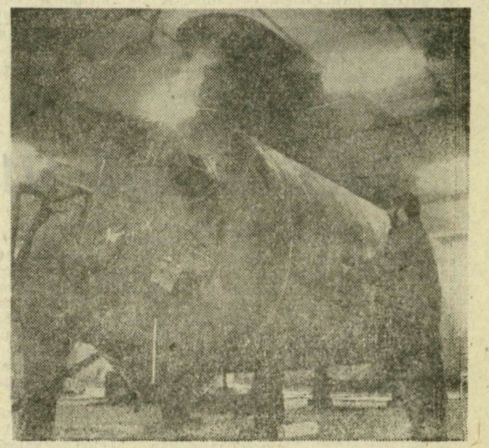
Somogyi Károlyné felvételei

Látványos, érdekes munkán dolgoznak a Szegedi Kazánjavító Isz dolgozói ezekben a napokban. A DELÉP megrendelésére négy, egyenként 15 köbméteres melegvíz-tároló tartályt készítenek, ezeket majd az Északi városrész kazánházában helyezik el. A henger alakú tartályok üzembe helyezésével gazdaságosabbá válik a víz melegítése, a kazánoknak nem kell állandóan üzemelni, lesz elegendő tartalék. Felvételünk a szerelőcsarnokban készülték.