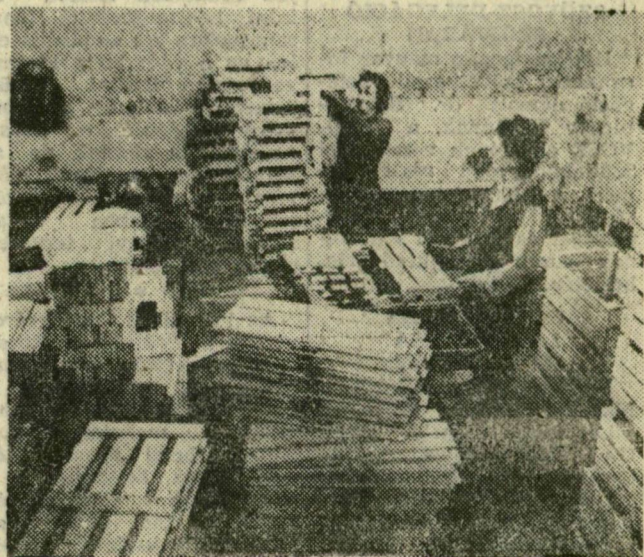
Szövelik a faládákat

A vitában sokan hangsúlyozták, hogy különösen nagyok a tartalékok a veszteségek csökkentésében, a berendezések gyorsabb javításában és az alkatrész-utánpótlás programozásának fejlesztésében. (MTI)