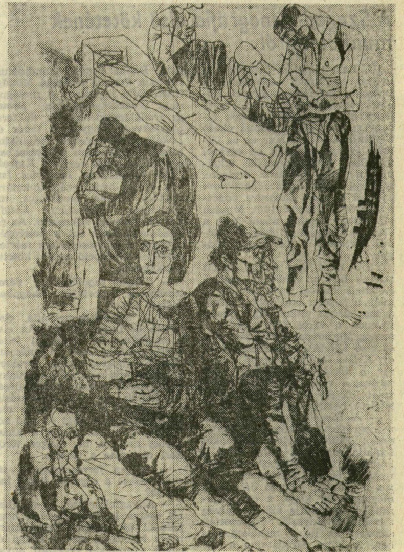
HINCZ GYULA, a XX. századi magyar képzőművészet egyik legsokoldalúbb egyénisége, 1904-ben született. Festészettel, szobrászattal, grafikával egyaránt foglalkozik, készített hatalmas méretű mozaikot és üvegablakot, egyik legnépszerűbb illusztrátorunk. Ő volt az országos grafikai biennálé első nagydíjasa 1961-ben. Képekünk egy rézkarc a József Attila verseihez készített illusztrációk közül.

A Móra Ferenc Múzeum Horváth Mihály utcai Keptárában látható az a kiállítás, amelyet a miskolci országos grafikai biennálé kilenc nagydíjasának alkotásából állítottak össze. A tárlat két évtized grafikai fejlődését is reprezentálja, s bepillantást enged kilenc kiváló magyar alkotó művészi birodalmába.