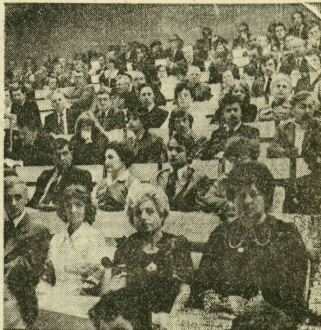
Résztvevők a pártértekezleten

Hogyan alakultak a lakosság életkörülményei? A beszámoló erről a többi között elmondotta, hogy a beszámolási időszakban mintegy 30 ezer ember költözött új lakásba, bővült az egészségügyi ellátás, fokozódott a gondoskodás az idős emberekről és a csecsemőkről. Növekedett az óvodai