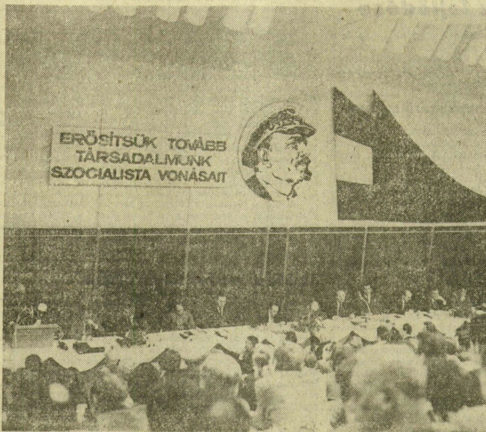
A szegedi pártértekezlet elnöksége