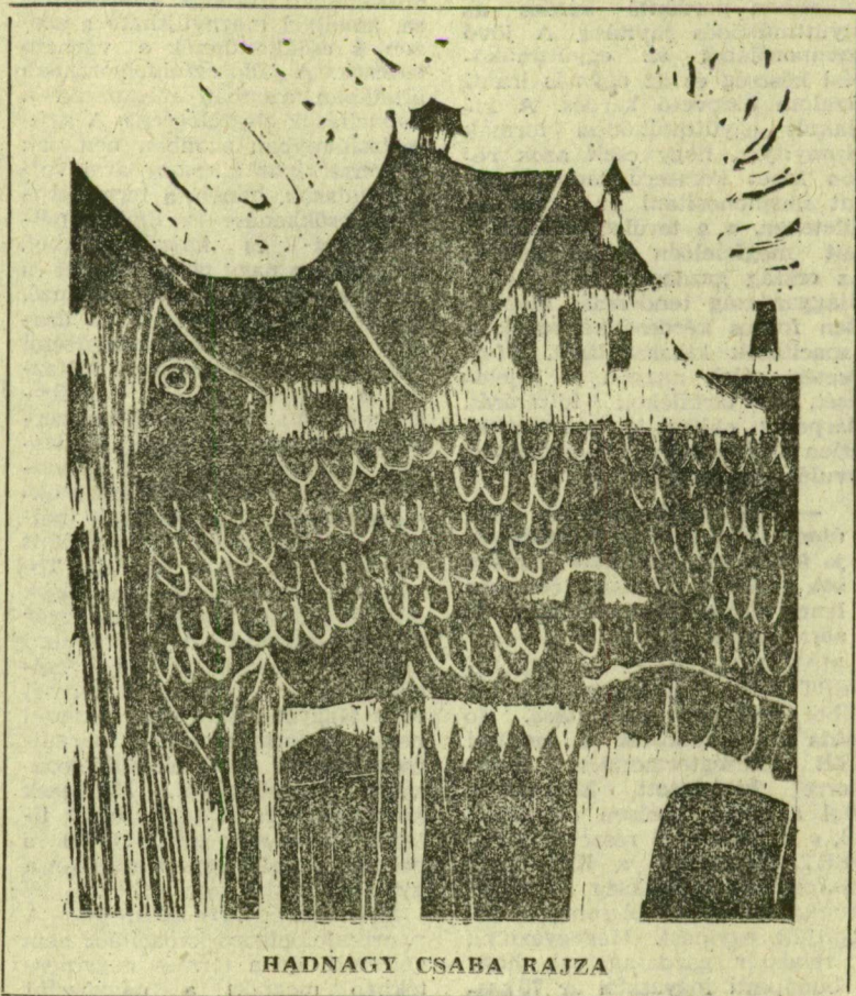
HADNAGY CSABA RAJZA