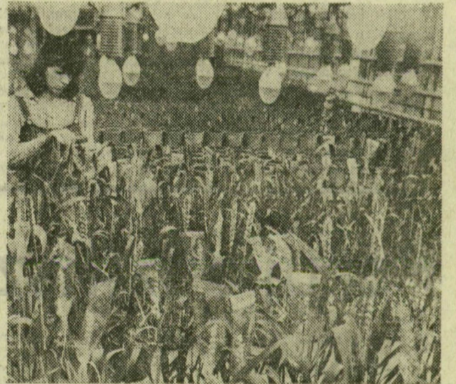
Egyetlen növényben több jó tulajdonságot lehet kifejleszteni keresztezés útján. E folyamat egyik műveletét mutatjuk be felvételünkön

Zöldellő búzatábla, kifejezett kalászokkal, persze nem a szabadban, hanem a Szegedi Gabonatermesztési Kutatóintézet klímaházában. Télen-nyáron, melegben és fényben folyik itt a növénynevelés, a napfény helyett 400 wattos kryptonégók világítanak. A megfelelő klíma beállításával elérhető, hogy például egy bizonyos búzafajtából három nemzedéket is felneveljenek egy év alatt.