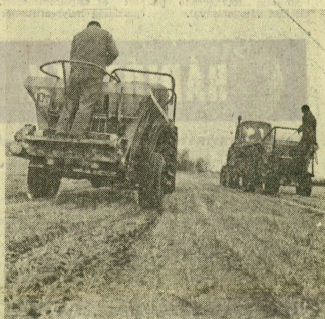
A forráskúti Haladás Tsz határában — ahol a talajviszonyok megengedik — folyamatosan szórják a műtrágyát az ősi kalászosokra. 1 ezer 620 hektárra juttatják el — a terek szerint — a hatóanyagot

Ugyanakkor készítik a másik 48 hektáros táblának is a terepet. Kiszedik az útból az eső fákat, újabb tanyákat bontanak le, márciusban kezdik a munkát. Balástyán nádat vágtak a Hortobágyi Állami Gazdaság dolgozói. Nehezebb most már a dolguk a gépeknek, mert fölengedett a talaj és könnyebben elülnek az ingo-