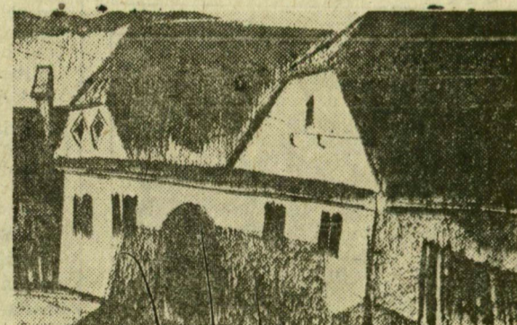
HADNAGY CSABA RAJZAI