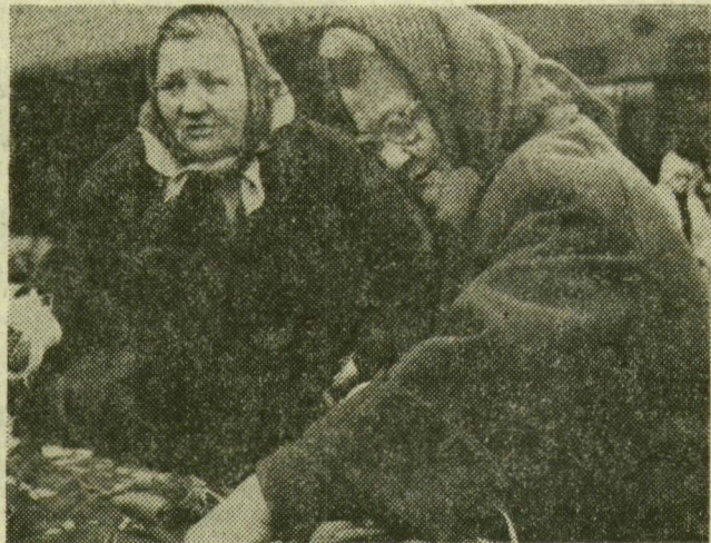
Zöldségvásárlás a Szent István téren

Hidegre fordult az időjárás, de a két szegedi piacon nincs hiány a zöldségfélékben. Lehet válogatni: sárgarépa, karfiol, káposzta, karalábé bőven található az árusoknál. Képeinken a Marx téri és a Szent István téri bevásárlás egy-egy pillanatát lestük el.