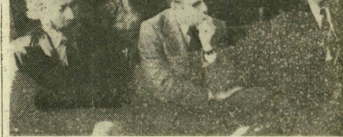
Számítástechnikai szakemberek a kongresszus megnyitóján

A kongresszus ma szekcióülésekkel folytatja munkáját. Az „A” szekció ülését a Technika, Házában tartják délelőtt 9 órától. Az operációkutatási módszerekről, az adatbáziskezelő rendszerekről, a mesterséges intelligencia alkalmazásairól és a számítástechnika orvosi felhasználásáról tizenhárom előadást hallhatnak az érdeklődők. A „B” szekció az Ifjúsági Házban folytatja munkáját, ugyancsak reggel 9 órától. Ezen a Hardware technológia, a központi egységek és a számítógép architektúrák kérdéseivel foglalkoznak. Kerekasztal-beszélgetés is lesz a Neumann-évről.