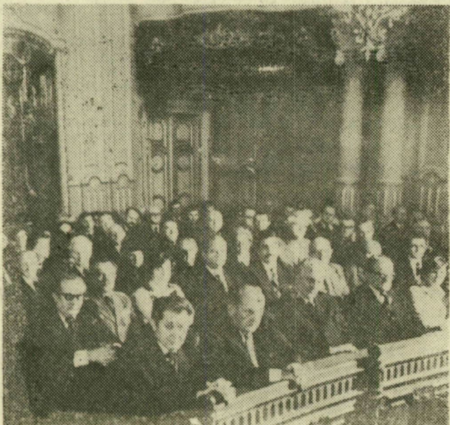
A résztvevők egy csoportja