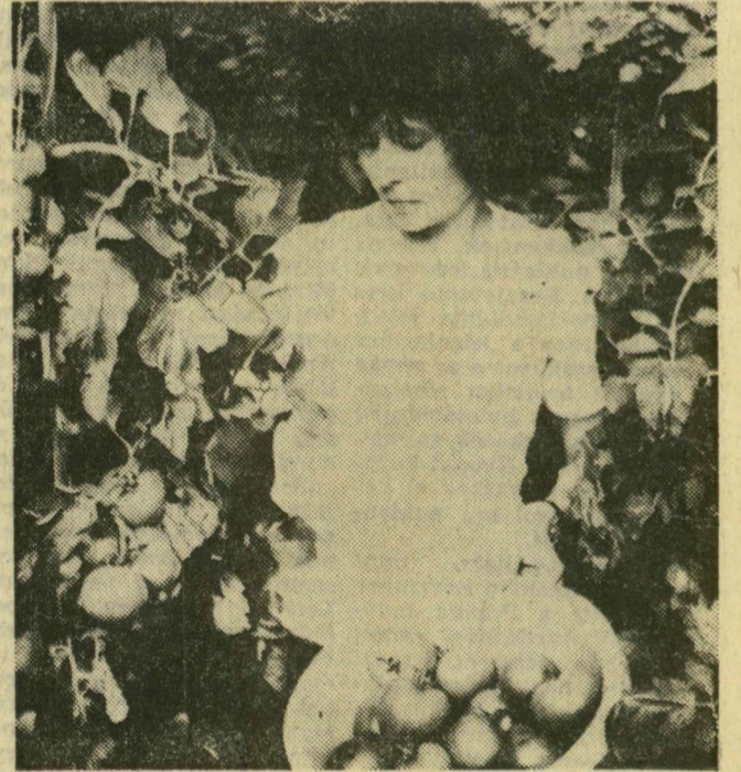
Paradicsomszüret a forráskúti Haladás Tsz üvegházában

Ötvennégyen dolgoznak a faiskolában. Ha végeznek a kitermeléssel, akkor sem áll meg a munka. Készülnek a következő évre: egész téli tisztítják a csemetéket, dugványokat.