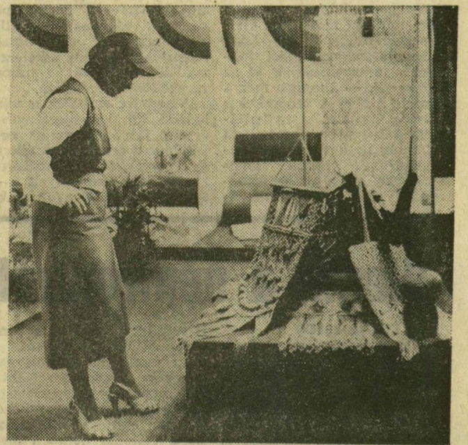
A Kenderfonó és Szövőipari Vállalat — kiválóan minősített — makraméfonalaiból készült iparművészeti cikkeknek nagy a sikerük

Az őszi Budapesti Nemzetközi Vásáron — ahol tegnap tartották az első közönségnapot — szép sikerrel mutatkoznak be a szegedi kiállítók. Több szegedi gyár termékét tartották almasnak arra, hogy vásári díjjal jutalmazzák. A KSZV acriláttal kent bórdíszmű-szövetcsaládját díjazták, s kiváló áru címet kapott a pépéx makraméfonala, amelyet egyre inkább fölhasznál az iparművészet is. Alább néhány szegedi kiállító „standját” mutatják be képeink.