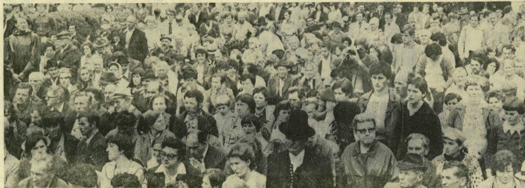
A politikai nagygyűlés hallgatóságának egy csoportja.