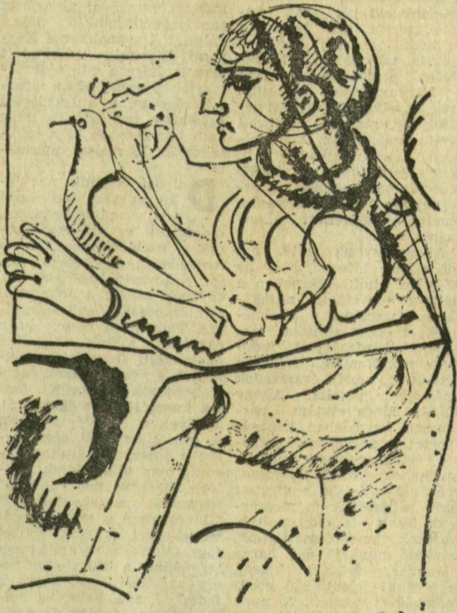
HINCZ GYULA RAJZA

Korábban az elnyomásban sínylődő nép sok nemzedéke, számos nagy történelmi személyiség harcolt az igazi alkotmányért. Augusztus 20-a eredetileg is egy új állam megalkotásának és megalkotójának, I. István királynak az ünnepe volt, aki államalapító és társadalomalakító munkája során felismerte az idő parancsát és a magyarságot átvezette egy idejétmúlt társadalmi formából, és életmódból az akkori újba. Ezután hosszú évszázadokig tartó, kíméletlen harc következett a nép érdekeinek képviselői és az elnyomók között. E harc egyik emlékezetes eseménye volt például a Rákóczi szabadság-