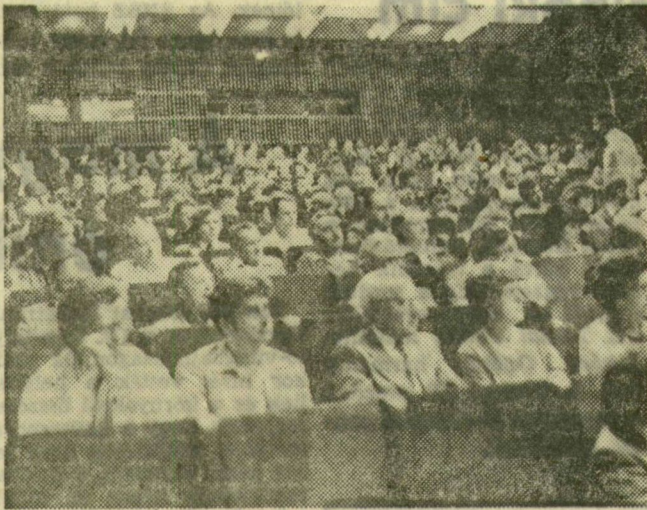
A nyári egyetem hallgatósága

Az idei nyári egyetem központi témakörének — az oktatástechnológia elmélete és gyakorlata — különböző kérdéseit összesen 18 előadás tárgyalja a kurzus kilenc napján, délelőttönként. Az elméleti jellegű munkát délutánonként az oktatástechnológiai gyakorlatról irformáló bemutatók követik. A témakör szakértőinek — a veszprémi Országos Oktatástechnikai Központ, az Országos Pedagógiai Intézet, az Iskolatelevízió, az Iskolarádió, valamint a felsőoktatási intézmények oktatástechnológiai központjainak munkatársai — kettős célja van: az előadásokon és a bemutatókon megismerjék a hallgatók a korszerű taneszközöket, illetve hatékony alkalmazásukat; meghatározzák az oktatástechnológia helyét, szerepét a pedagógiában.