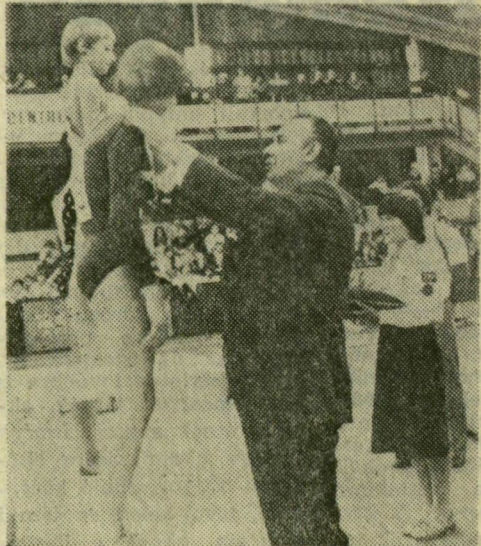
Az MSZMP KB titkára adta át az érmeket a tornász lányoknak

Az Egyesült Zöldség- és Burgonyatermesztési Társulás többi gazdaságában nemrég kezdtek a korai krumpliasásához. A bordányi Előre Szakszövetkezetben, a ruzsai