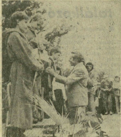
A miniszterelnök-helyettes gratulál a kisdobos úszóknak