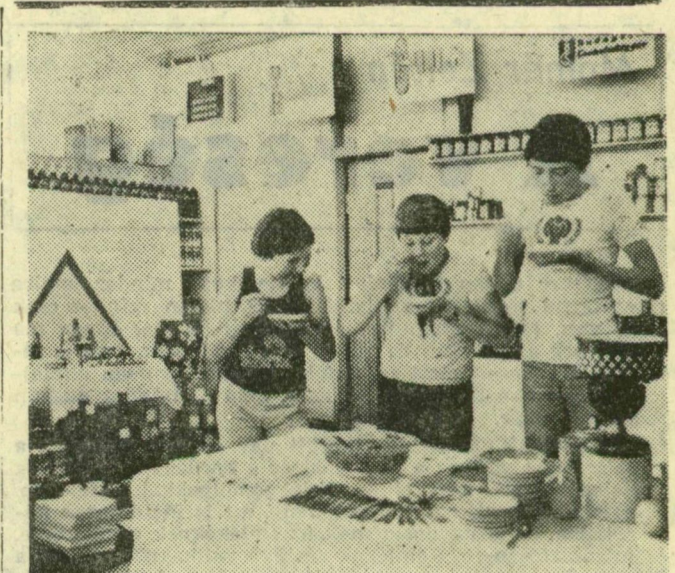
Jól időztettek — a kempingezés idejére — azt a kóstolóval egybekötött árubemutatót, melyet tegnap, csütörtökön a Szegedi Konzervgyár és a ZÖLDEK rendezett a tarjáni, 30-as számú ABC-áruházban. A legkülönfélébb konzerveket mu'atták be, bon'ották fel és kóstoltatták meg az érdeklődőket. Azoknak, akiknek ízlett az üzletben kínált csemege, könnyű dolguk van, hiszen a boltban kapott receptek alapján, otthon is elkészíthetik a konzervek felhasználásával ételüket.

Cegléden, a Fűrész-, Lemez- és Hordógyár ipartelepén, 220 millió forintos költséggel elkészült a székülés és -támlaüzem. A technológiát a finnországi Lah-tiból, a Rau-Te cégtől, néhány speciális gépet az NSZK-ból vásároltak. Az 1600 négyzetméter alapterületű csarnokban megkezdődött a termelés. (MTI)