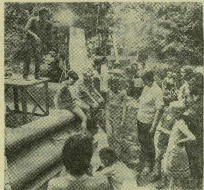
Diszietek, lámpák és maszkos gyerekek a Vidám Parkban, a Virágfüzér felvételén