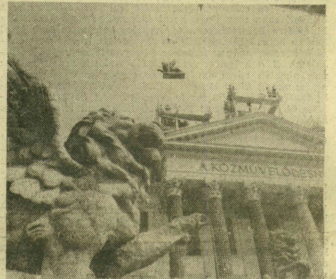
A földet ért kőoroszlán társára vár

Az oroszánok és társai most a várkertbe kerülnek, az újrarafragott homokdíszeket körülbelül két év múlva emelik be a helyükre. Az állványzat addig az épület tetején marad.