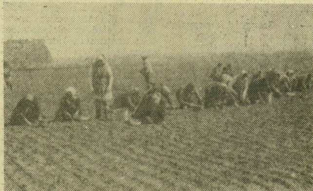
Röszkei asszonyok duggatják a hagymát

bőven! Majdhogy éjjelük-nappaluk egy a röszkeieknek, mivel vége felé tart a reteksezon. Voltak, akik már előző nap este sorba álltak a főlvásárlótelep előtt, hogy hajnalban, az átvétel megindulásakor elsőként legyjenek. Naponta 200-300 ezer csomó cserél gazdát.