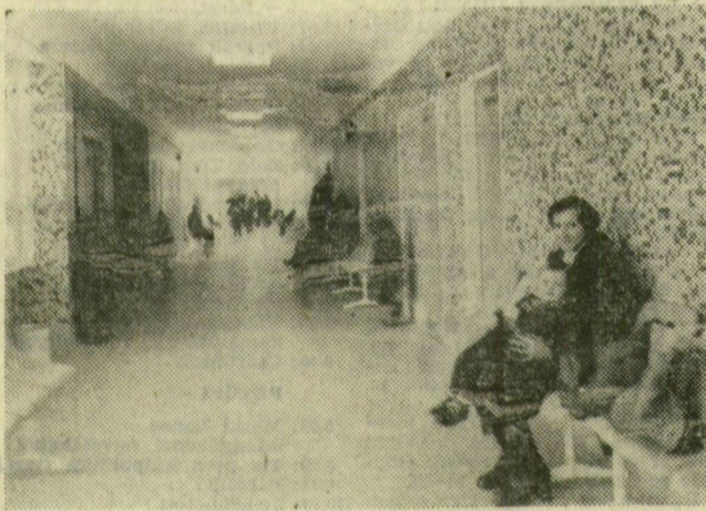
A várakozás percében itt már csak emlék a régi rendelőintézet zsúfoltsága

Alig több mint egy hónapja adták át a vasutasoknak és családtagjaiknak a MÁV új rendelőintézetét Újszegeden. Azóta sok beteg — felnőtt és gyermek — megfordult már a négyzetes épület rendelőinek, laboratóriumainak, kezelőinek valamelyikében.