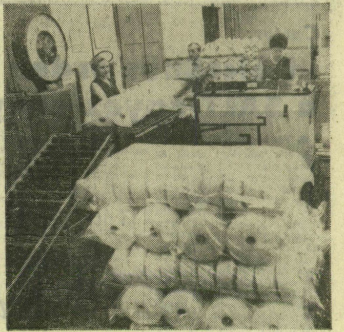
Mélegre kerülnek a fóliába csomagolt fonalak