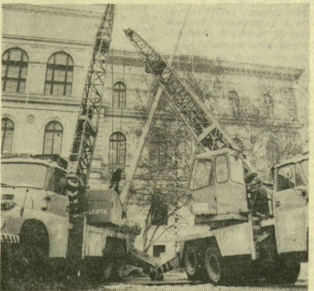
Az egyetemi épület főbejárata előtt daruvál emelik ki az útban levő kandalábereket

eddig nem volt példa — most pedig ez történt a szökőkút esetében. Társadalmi munkára is ajánlottak a közreműködők: így lesz elég a városi tanácstól és az Országos Vízügyi Hivaltól kapott ötmillió forint.