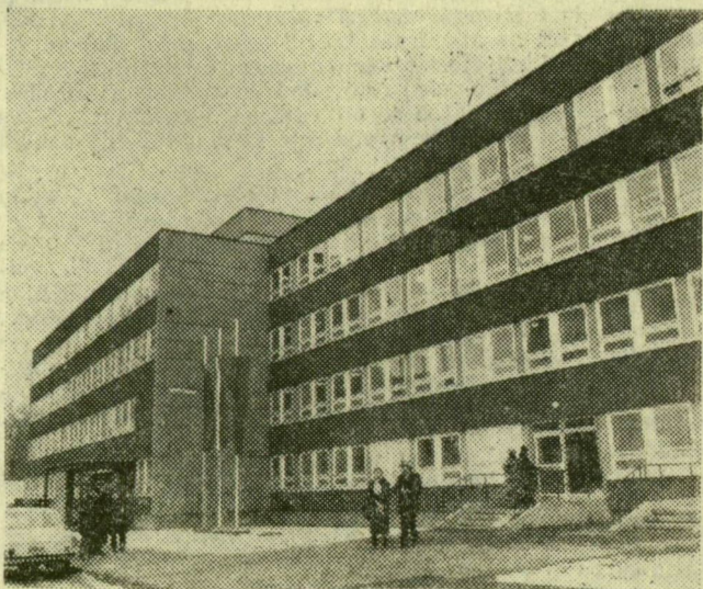
Az új rendelőintézet homlokzata

Lovász László végül köszönetet mondott mindazoknak, akik munkájukkal hozzájárultak mintegy 45 ezer vasutas dolgozó — családtagjaik és a nyugdíjasok — magas szintű egészségügyi ellátásának megteremtéséhez. Az ünnepségen Gulyás János, a MÁV vezérigazgatóhelyettese jelképesen átadta